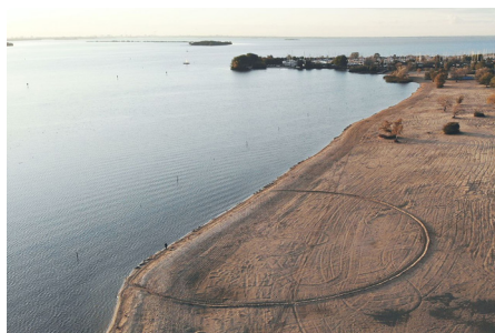
Naam: PolderPier Locatie: Almeerderstrand Opdrachtgever: Gemeente Almere, standlab Ontwerp: Dingeman Deijs, Dennis Koek en Jolle Roelofs Project: Pier op het Almeerderstrand