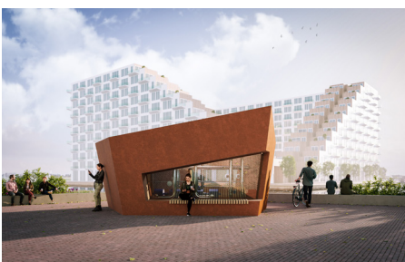
Naam: Warmte Overdracht Station Locatie: Steigereiland Opdrachtgever: Vattenfall Ontwerp: Dingeman Deijs en Dennis Koek Status: Opgeleverd