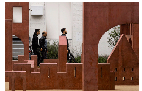
Naam: Ode aan de poorten Locatie: Zwolle Opdrachtgever: Gemeente Zwolle Ontwerp: Dingeman Deijs, Dennis Koek Project: Multifunctioneel speel- kunstobject