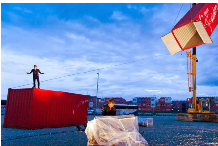
Naam: Dutch Vinex Wonderboys Locatie: Amsterdam, over het IJ festival Opdrachtgever: Bontehond Ontwerp: Jolle Roelofs, Tjebbe Roelofs Thema: opgroeien op een zandvlakte