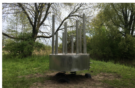
Naam: Megawaterfoon Locatie: Potmarge, Leeuwarden Opdrachtgever: Arcadia Ontwerp: Jolle Roelofs Project: een kunstwerk en een muziekinstrument ineen